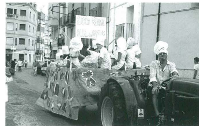
Carrossa del CCR a les Festes Majors

Per la tarda del diumenge, el Centre Cultural Recreatiu va participar en la gran desfilada de carrosses. Els nens, tots disfressats de cuiners s'ho van passar molt bé remenant l'olla, tirant serpentes, caramels... confetti..., van gaudir molt!