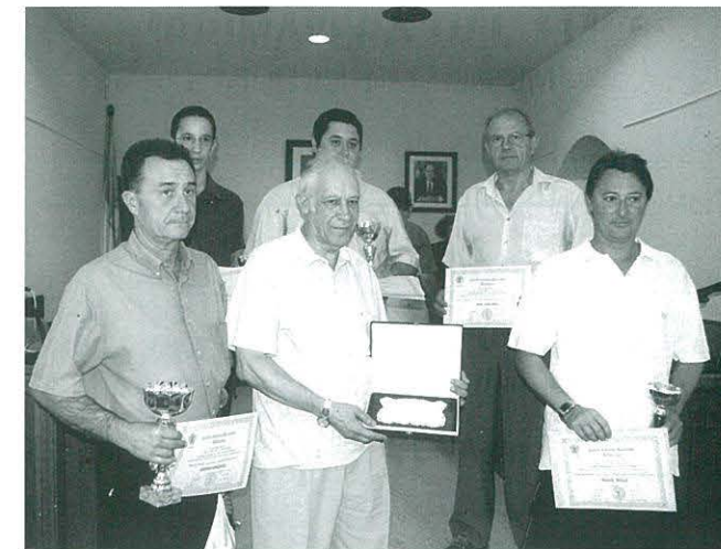
Lliurament premis del Concurs-Exposició de Maquetes