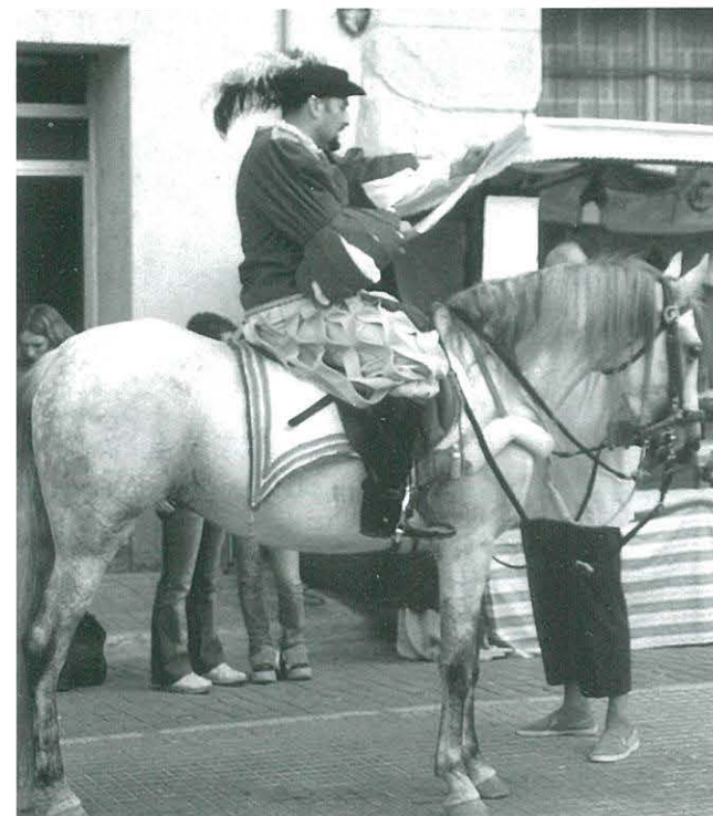
Festa del Renaixement de Tortosa

A la Festa del Renaixement a Tortosa, va estar hi present amb l'actuació dels membres del Grup de Teatre seleccionats per a participar en alguns actes: En el pregó oficial de la Festa donant entrada a les autoritats i fent el lliurament de les banderes de la ciutat, en el pregó del carrer diari informant dels actes a celebrar cada dia, interpretant unes al·legories i unes escenes de carrer, en l'acte d'obertura del Portal del Romeu, en la partida d'escacs vivents i en l'acte de clausura i desfilada de final de festa. Us hem de dir que va ser una bona experiència que esperem repetir els pròxims anys.