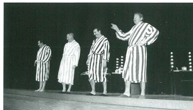
Representació de l'obra "MASCLISTES", a càrrec de la companyia Guix i Murga

Aquest any l'encarregat de portar l'obra de teatre de les Festes Majors va ser el CCR. Durant tot l'any, moltes van ser les obres que es van mirar per a portar, però finalment l'obra elegida va estar MASCLISTES , de la companyia Guix i Murga. Quatre actors molt coneguts per tots nosaltres ens van delectar amb una obra divertida i fresca, que tot i ser una crítica a les dones, fins i tot elles van riure de valent.