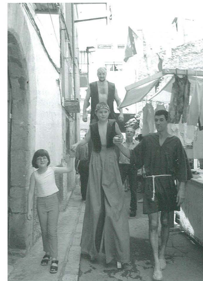
Actuació dels components del CCR i típica paradeta al Mercat Medieval d'Ulldecona

També vam col·laborar al Mercat Medieval d'Ulldecona que organitza la Colla Gegantera i els Grallers.