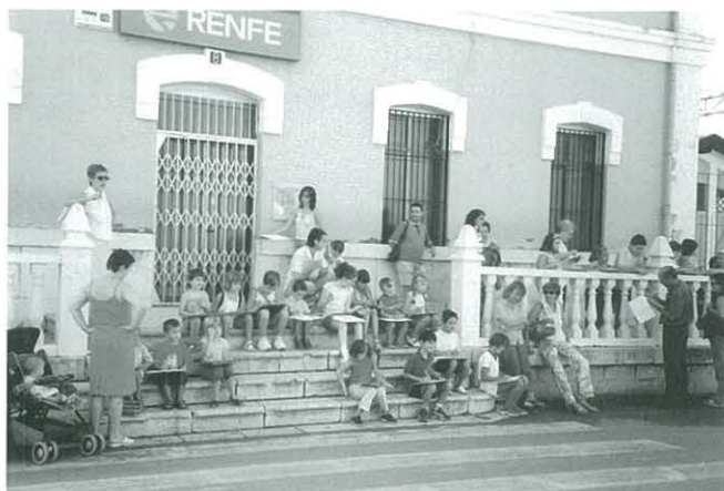
Participants en el Concurs de Dibuix Ràpid

Un any més i seguint la tradició, el primer dissabte de festes, el dia 23 d'agost vam organitzar el 32 è Concurs de Dibuix Ràpid. Aquest any van dibuixar la plaça "dels peixets" o bé l'estació de trens; molts van ser els nens i nenes que van participar; gràcies a tots ells, a més el Bar Celedoni, els va obsequiar amb un tiquet per a un gelat, que com us podeu imaginar va ser molt ben acceptat per la mainada.