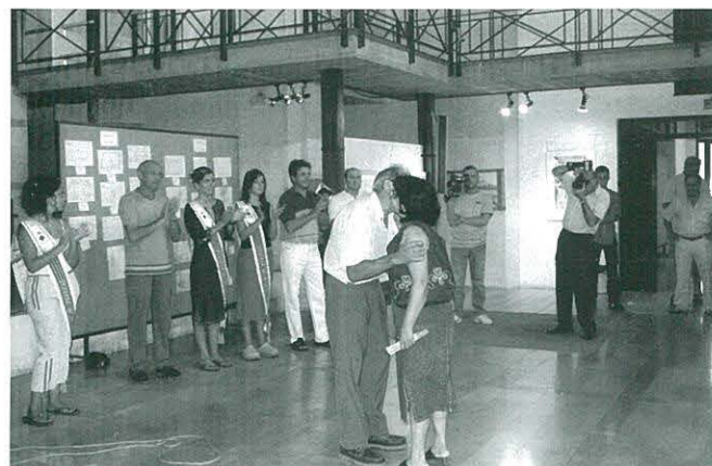
Lliurament de premis del Concurs de Pintura Ràpida