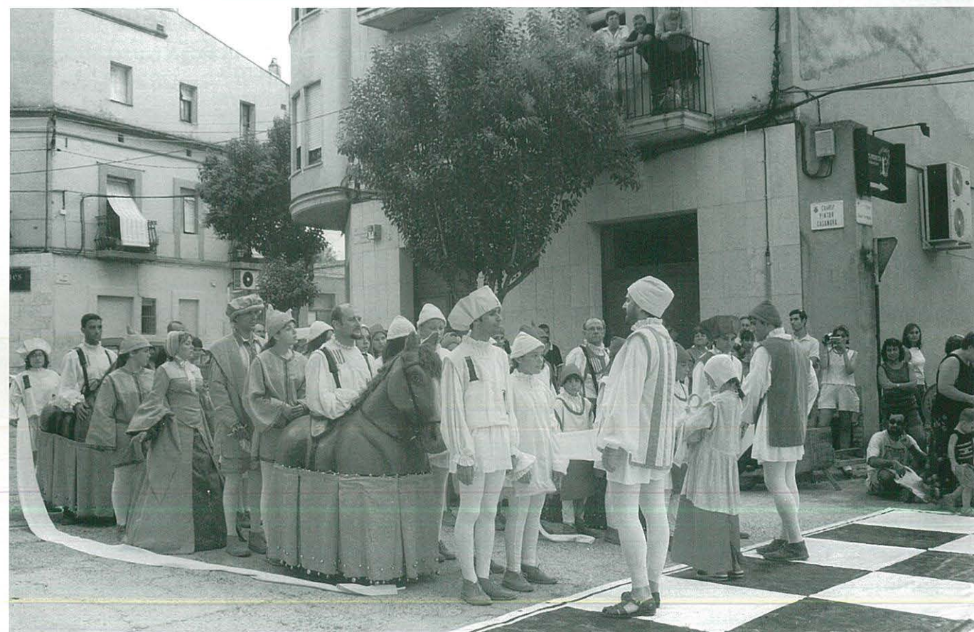
Membres del CCR participant en la Festa del Renaixement de Tortosa