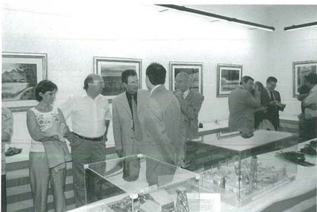
Inauguració de l'Exposició-Concurs de Maquetes

La nit del dissabte i dintre de les activitats del pregó, el CCR va inaugurar a la sala d'exposicions de Caixa Tarragona la XII a Exposició-Concurs de Maquetes, i a la Casa de Cultura els dibuixos fets pel matí al Concurs de Dibuix Ràpid.