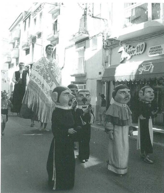
Desfilada de Nanos i Gegants

També com és costum, els nanos van acompanyar els més menuts la tarda del ball de mantons i en la desfilada dels gegants.